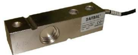
Celda de carga en INOX, IP68