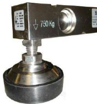
Celda con pata pivotante INOX